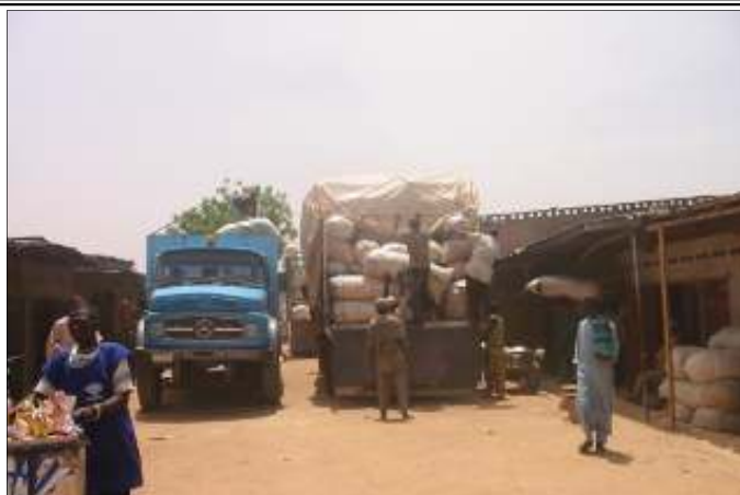
Des chargements de maïs, de mil et de gari quittent chaque mardi le marché de Dawanau pour Maradi au Niger pendant la crise.

Le tableau ci-dessous montre les détails des transactions enregistrées entre le 1er juin et le 22 août 2005 au niveau des trois produits. La contribution