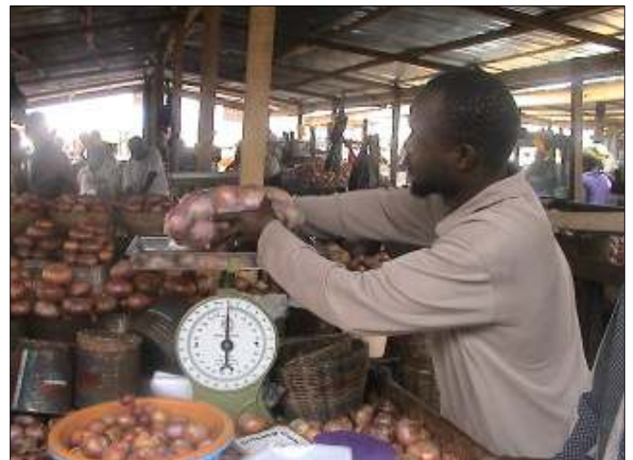
Un commerçant se sert d'une balance, fournie dans le cadre du projet pilote par MISTOWA, pour peser ses produits dans le marché d'Agbogbloshie.

Au Nigeria, l'Association du Marché de Mile 12 de Lagos fait aussi la promotion de l'utilisation des balances pour vendre les céréales et les légumineuses.