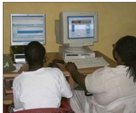
Le nouveau PICA à Agbogbloshie offre des postes informatiques connectés à Internet à ses membres et au public pour accéder à l'information agricole en ligne, comprenant les prix, contacts et bien plus.

TradeNet, nous utilisons le bouche-à-oreille pour l'information de marché, mais après notre initiation au nouveau logiciel nous avons été capables de rendre nos affaires plus profitables que jamais auparavant."