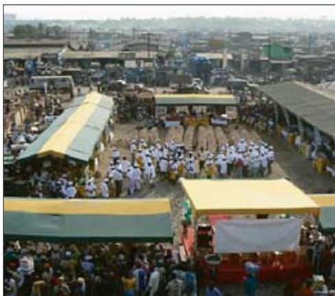
Une vue aérienne de l'inauguration de GAPTO et du lancement du PICA, qui a eu lieu au cœur du marché d'Agbogbloshie à Accra le 31 janvier 2007. Des commerçants locaux se sont joints aux chefs communautaires, aux officiels gouvernementaux et aux représentants de l'USAID, BusyLab et MISTOWA pour célébrer l'événement.