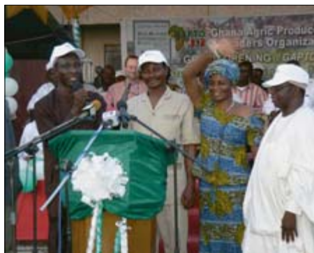
Une délégation de commerçants nigériens des marchés de Dawanau et Mile 12 ont partagé leurs expériences de TradeNet, encourageant d'autres à utiliser ses services.