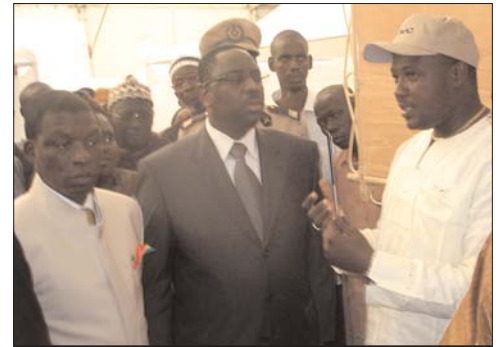
Le Premier Ministre sénégalais, Macky Sall, découvre comment le portail commercial de MISTOWA renforce le commerce ...voir page 3

Dans ce numéro, nous vous présentons la Conférence sur la situation agricole et alimentaire, le "Village MISTOWA" lors de la FIARA à Dakar au Sénégal et la formation APFOG organisée en vue de renforcer les compétences en matière de gestion. L'appui fourni par MISTOWA servira à assurer la croissance et la durabilité des ces organisations. Le succès écrasant de la première conférence de l'année 2006 sur la situation agricole, tenue à Ouagadougou au Burkina Faso, montre l'importance de la participation active des commerçants et des producteurs dans le but de renforcer le commerce en Afrique de l'Ouest.