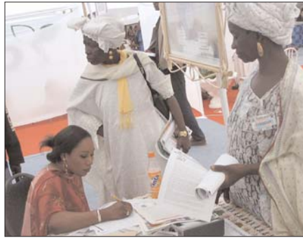
Les commerçantes sénégalaises font escale au "Village MISTOWA" pour découvrir le projet et voir ce qu'il peut leur apporter.

Pour permettre aux associations de commerçants et de producteurs de tirer profit de la participation à une telle foire, MISTOWA a sponsorisé cinq commerçants du Niger et du Sénégal à la FIARA, du 1 er au 8 mars 2006. Avec l'appui financier de MISTOWA, les représentants des associations sénégalaises membres du ROPPA et du ROESAO (Réseau des Opérateurs Économiques du Secteur Agroalimentaire de l'Afrique de l'Ouest) avaient seulement payé leurs frais de transport et d'hôtel. Les délégués ont aussi représenté leurs associations locales—Transfruilleg, le RADEC, La FEITLS, FENATRAPROMER—lors de cette manifestation.